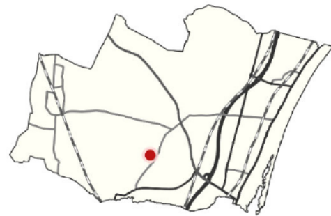
Figur 1 områdets placering i kommunen

Den ældre del af landsbyen er centreret om Jersie Kirke og vejene Nordre- og Søndre Byvej danner et linseformet vejnet, hvor boligerne ligger i tilknytning til. Det kulturhistoriske landsbymiljø er hovedsageligt bevaret omkring Nordre- og Søndre Byvej, hvor bevaringsværdige huse blander sig med karakteristiske huse fra nyere tid der repræsenterer den pågældende tids arkitektoniske idealer og som mere eller mindre tilpasser sig landsbybebyggelsen.